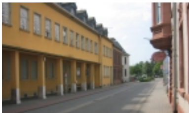
Areal der „Alten Post“ in der Bahnhofstraße