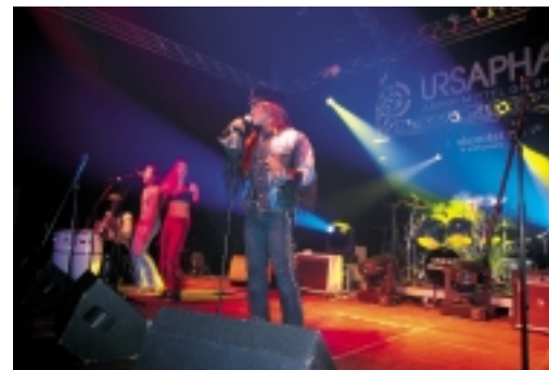
Glanzvoller Event - die TOP Party des Saarland Magazins

Veranstaltungs- informationen erhalten Sie: Musik & Theater Saar GmbH Zeltpalast Merzig Saarwiesenring 66663 Merzig Tel.: 0 68 61/ 93 52 11 Tickethotline 0 68 61/ 93 52 99