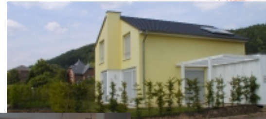
Musterhaus „Ahorn“ der LEG Saar