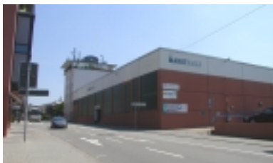
Blick auf die Markthalle aus Richtung Brauerstraße