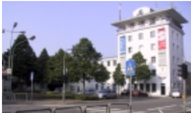
Der St. Médardplatz heute

erteilt. Mitten im Herzen der Stadt - auf dem Gelände der ehemaligen Brauerei und der „Alten Post“ - soll ein neues, modernes Einkaufszentrum mit Parkhaus entstehen.