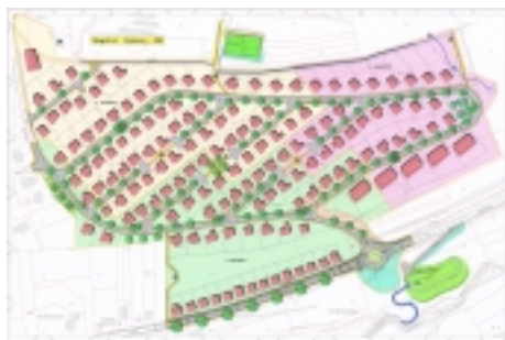
1. Bauabschnitt 2. Bauabschnitt 3. Bauabschnitt

Aktueller Bauplan mit vorzugsweise Einzelhausbebauung